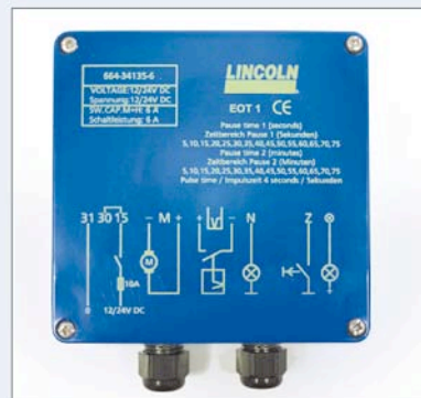
EOT1 – EOS контроллер

с размером и длиной цепи. Дозирующие элементы с разным объемом подачи 0,1, 0,3, 0,4 или 0,5 см 3 удовлетворяют любое требование.